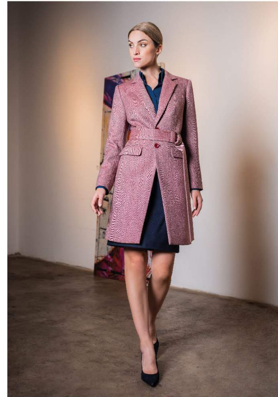
Conjunto 5 Sacón/Blusa/Falda