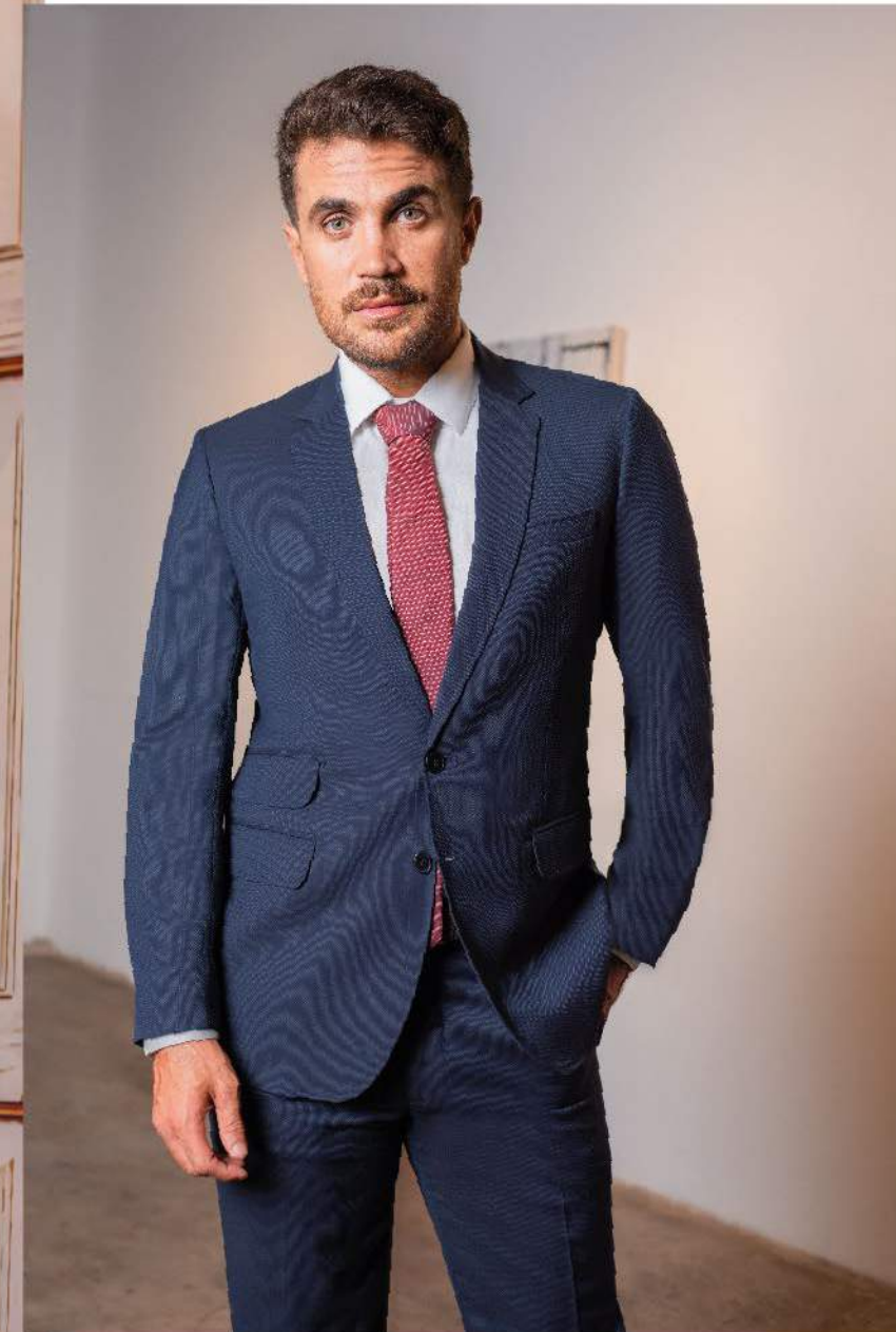
Caballero 1 Terno