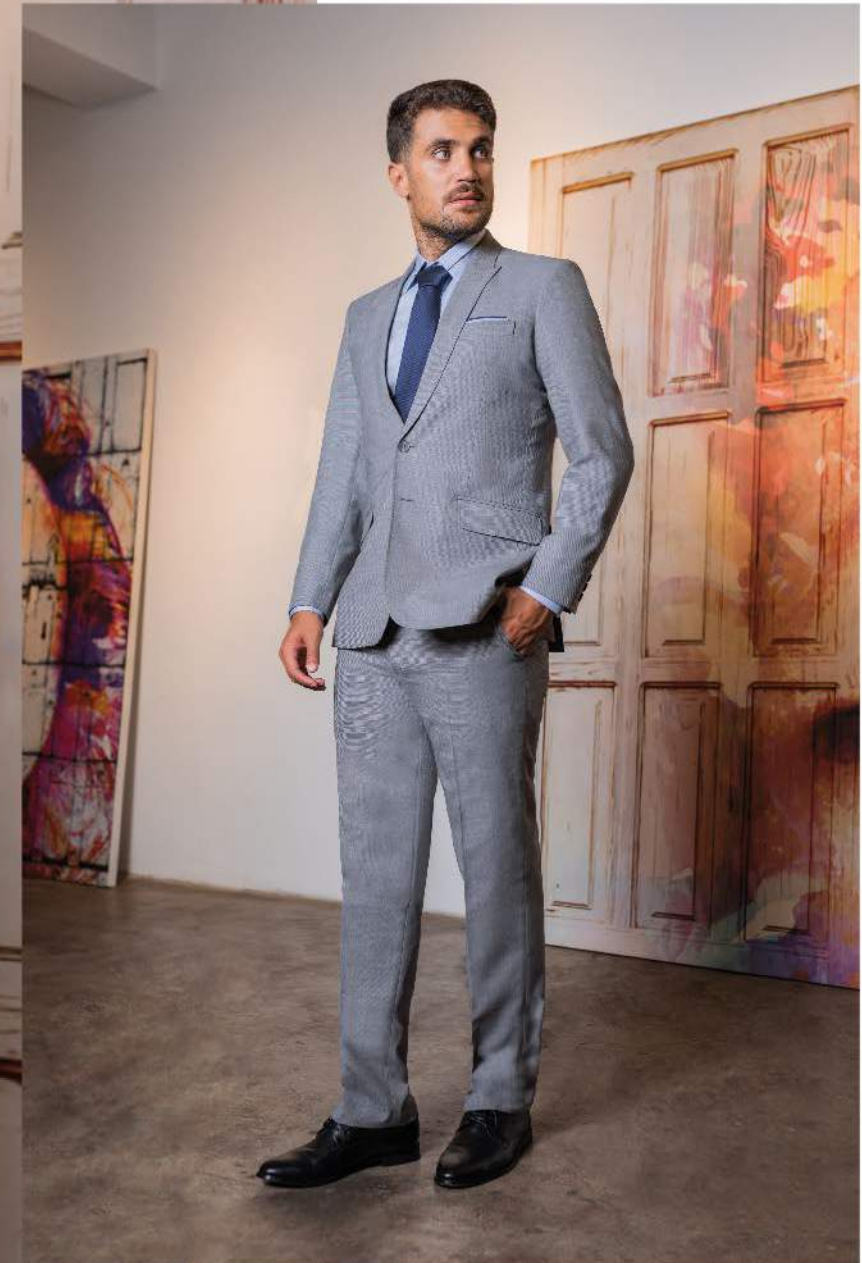
Caballero 2 Terno