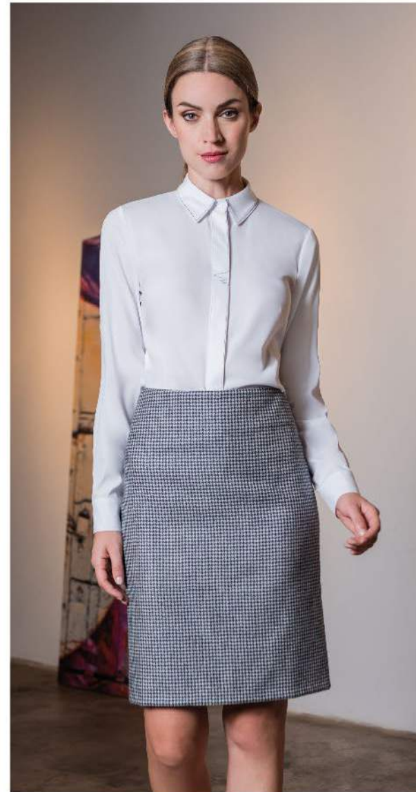
Conjunto 6 Sacón/Blusa Falda/Saco